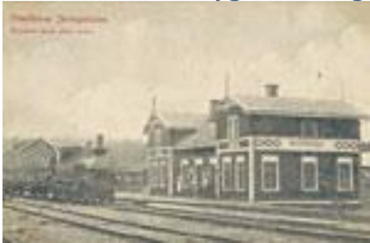
Gamla stationshuset i Otterbäcken